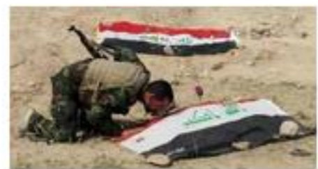
الحشد الشعبي ماكنة الموت ... انتقاله بين ضفتي الحياة